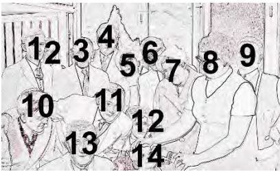
1 Frans Heffels 2 Oom Opgenoord 3 Smeets 4. Ad Feijen 5. Gon Heggen 6. Sjaak Cremers 7. Mw. Gijzels 8. Tante Opgenoord 9. Vader Opgenoord 10. Nic Opgenoord 11. Frits Derhaag 12. Bertha Claessen 13. N.N. 14 broertje Nic Opgenoord.