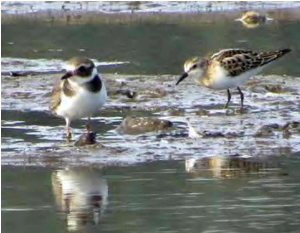
Bontbekplevier en Kleine Strandloper, in juvenielkleed.