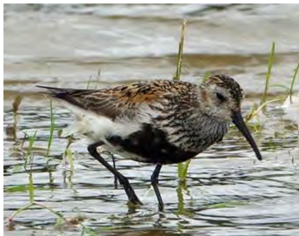
Bonte Strandloper, adult in zomerkleed.