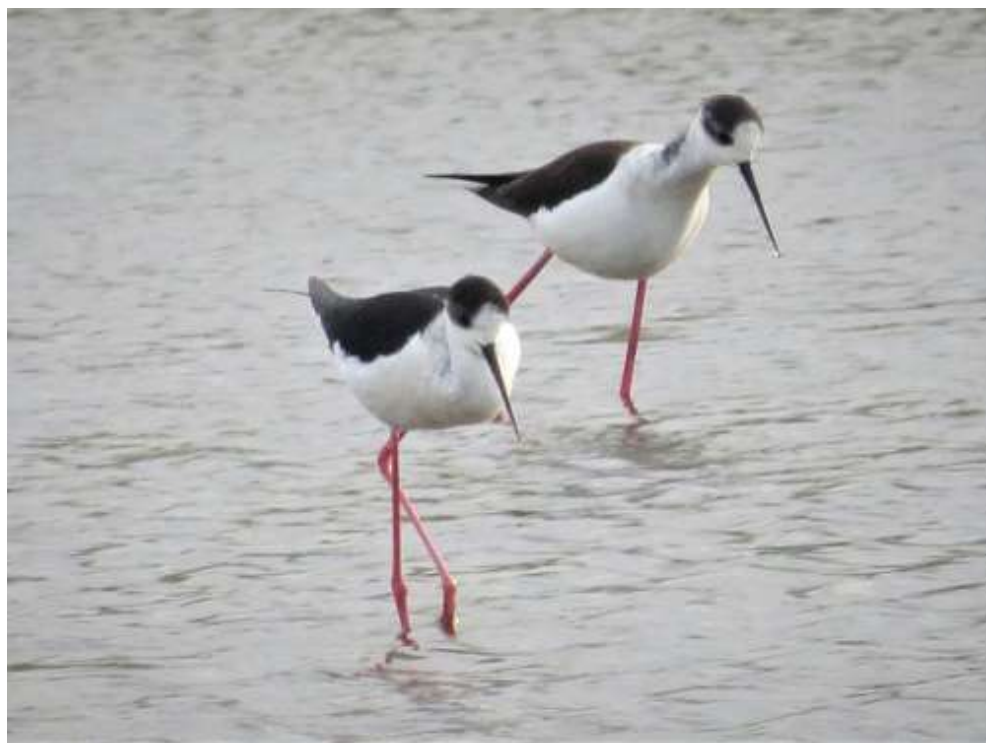
Steltkluten in zomerkleed, kalkmoeras.

Beide geslachten kunnen in zomerkleed een volledig witte kop hebben, ook kunnen kruin en nek in verschillende mate zwart zijn. De mannetjes zijn in zomerkleed herkenbaar aan de mooie groenglanzende zwarte bovendelen, bij vrouwtjes zijn deze