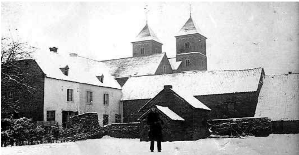
Woningen, schuren en stallen in laatste restanten abdij gebouwd door Bernard Schulpen. Twee dochters bewoonden deze aanvankelijk vanaf ca. 1810. Opvallend is dat er nog maar één bakhuis staat.