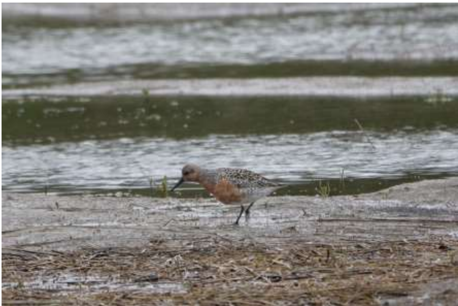
Kanoet Calidris canutus , ruiend naar broedkleed. Kalkmoeras IJzerenbos, 7-5-2021: Foto: Hub Corten

Hoewel de Kanoet sterk gebonden is aan zoute milieus, komen in Limburg op doortrek vooral langs de Maas kleine aantallen voor. Uitzonderlijk is de waarneming op 7-5-2021 in het kalkmoeras IJzerenbos.