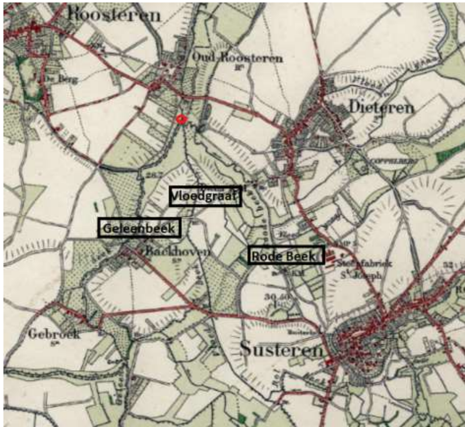
Kaartje met Geleenbeek, Vloedgraaf en Rode Beek met plek, aangegeven met (rode) punt, van samenvloeiing, in 1925. Bron: Kadaster Apeldoorn